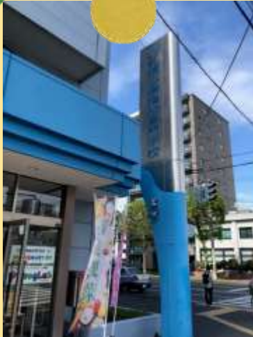
札幌心療福祉専門学校外観

今回は、円山地区にある札幌心療福祉専門学校で10/2（土）に開催された、「心福マルシェ」の様子と、豊水地区で実施されたウォーキングに参加してきました。