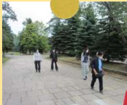
ショートコース参加者 交通事故のリハビリがてら 参加された方も。