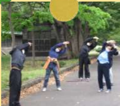
全員で ウォーキング前の準備運動

今年度から農福連携を学びの一環として取入れ、就労B型事業所の方と一緒に北区屯田の農家さんの野菜販売を実施したとのことでした。隣接地区の町内会にも回覧板が回り、当日は開始10分で主要な野菜が売り切れるなどとても盛況でした。中央区の生活支援コーディネーターや推進員もお邪魔させていただきました。学校側としても、今後は企業や社協と連携した授業を思案中とのこと、生活支援の参入もさせていただきたいところです。