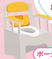
ポータブルトイレ