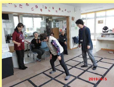
さろん《ふまねっと体操》の様子