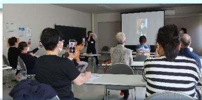
あけぼの団地生活支援アドバイザーイベント

このほかにも、真駒内地区では、あけぼの団地の生活支援アドバイザーイベント(スマホ体験)、第3地域包括支援センターと各ブロック民生委員の情報交換の場、藻岩下地区では、第3・第4町内会の出前講座(青空教室)、福まち6月例会などに参加させていただきました。