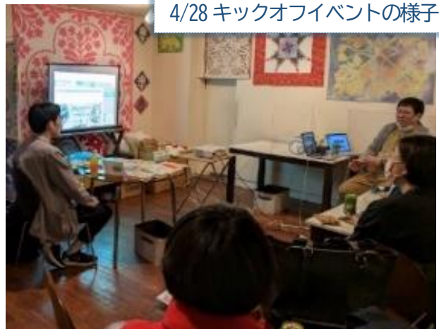
4/28 キックオフイベントの様子