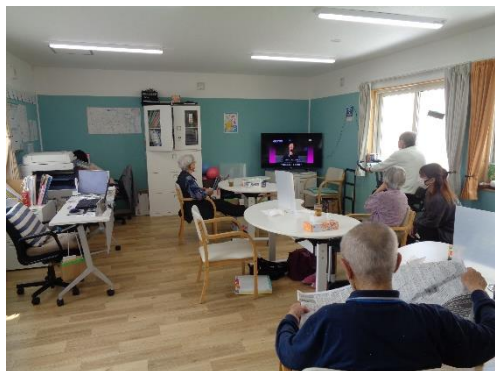
お風呂に入ってくつろいでいる方やこれから入浴の方、皆さん思いおもいに過ごしています