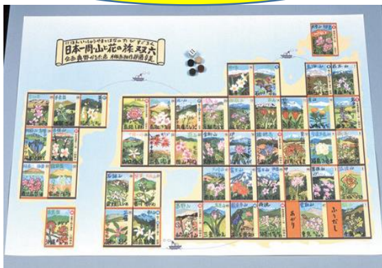
日本一周・山と花の旅すごろく