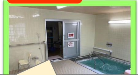
皆様がお楽しみのお風呂も充実。銭湯の ような心地よいひと時をお楽しみください。