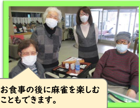
お食事の後に麻雀を楽しむ こともできます。