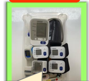
バイタルチェックや検温 を毎日行います。