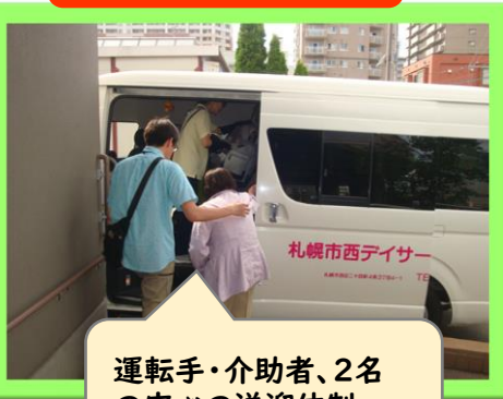
運転手・介助者、2名 の安心の送迎体制。