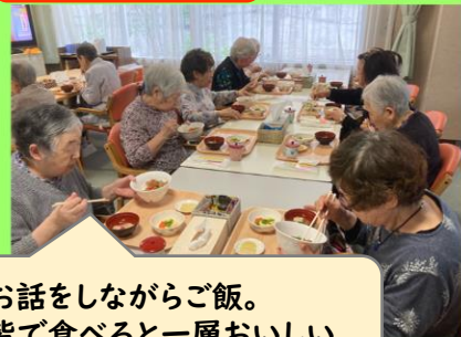
お話をしながらご飯。 皆で食べると一層おいしい。