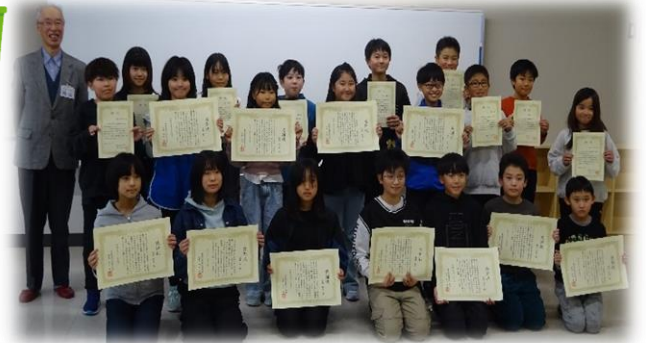
【栄北小 ゴミーズセカンドのみなさん】

自分たちの地域を良くしたいという思いがあっても、実際に続けていくことはとても大変なことです。メンバーの頑張りや思いが、支え合いや助け合いとして地域全体に広がり出しています。