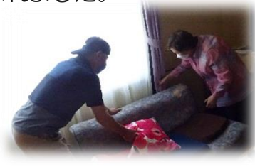
人と関わるのが好きな方、大募集！