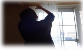
自分のためにやってみたい