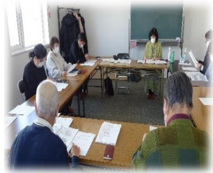
【丘珠地区 意見交換の様子】

最初に10月の福まち研修会の際に配布し調査した生活支援に係わるアンケートの結果を報告し、この調査結果から把握できたコロナ禍における生活や町内会活動の様子、さらに今後力を入れて行いたいこと等を参加者のみなさんで共有しました。