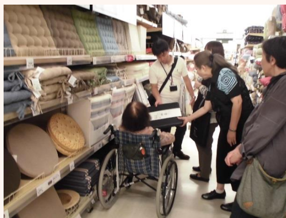
お店に行くことで自分で選べる嬉しさがあります

この活動は、依頼者の自宅のベットから居間にかけてフローリングのため滑りやすく、何度か転倒をしており、絨毯を購入したいとの相談を北相談センターのケアマネジャーからいただき、北区社協のボランティアコーディネーターが状況確認などで自宅を訪問。必要な大きさなどを確認し、ボランティア活動者を募ったところ、男性1名、女性2名が手を挙げてくれました。