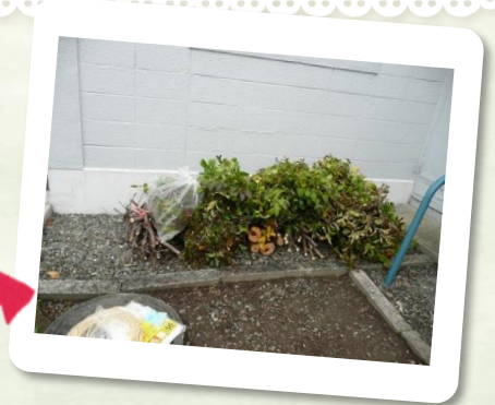
資源ごみの日に、ゴミステーションまで草木ゴミを運搬して完了！