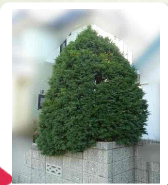
スッキリしました♪