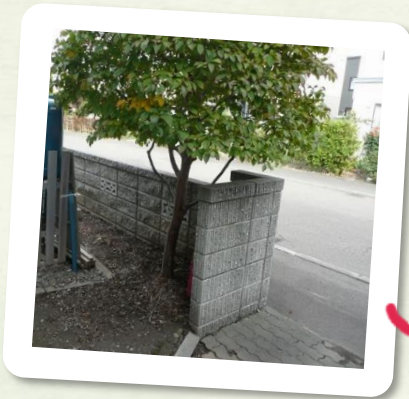
玄関前にある木の伐採