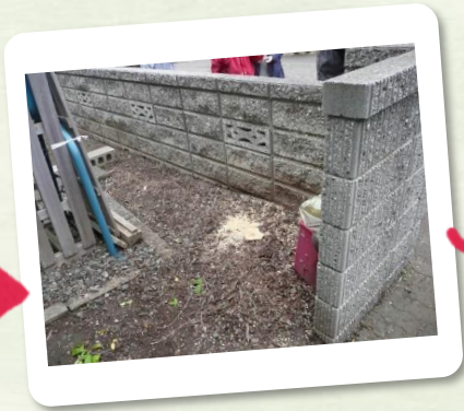
キレイになりました♪