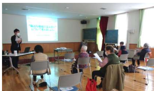
北地区 令和3年12月20日（月） すこやか倶楽部（北24条会館）