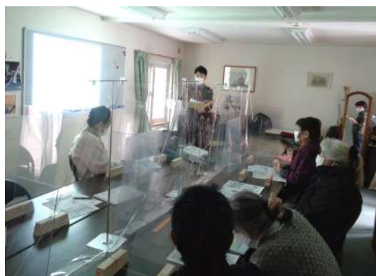
幌北地区 令和3年12月17日（金） すこやか倶楽部（すこやかホーム）