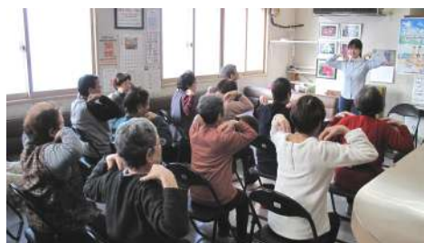
雪や氷に足を取られて転倒しやすい冬の季節に、ケガをしないための「転倒予防体操」

体操の後、お時間をいただいて、生活支援コーディネーターの役割と、高齢者が抱えるちょっとした困りごとに対して取り組んでいるボランティアグループの活動を紹介するなど、支え合い活動に関するお話を皆様にさせていただきました。参加者からは「絶対に今後必要なことだよね。」「昔は身内で解決するのが当たり前だったんだけどね。」等、色々な意見をいただきました。今後も支え合い活動が地域に浸透していくように、啓発活動を続けていきたいと思えます!