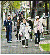
健康ウォーキング