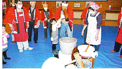
ふれあい餅つき大会