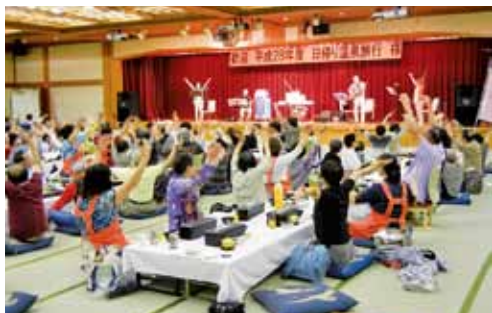
ひとり暮らし高齢者日帰り温泉旅行