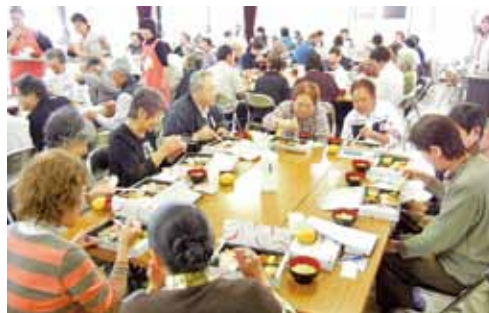
ひとり暮らし高齢者お食事交流会

ひとり暮らし高齢者を対象とした温泉旅行や食事会を実施しています。こうした行事にできるだけ多くの方に参加いただき、楽しい時間を過ごしていただくことで、地域の方々とのつながりができ、各町内会の行事への参加にもつなげていきたいと考えています。