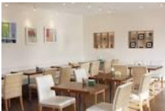
白を基調とした店内

プティパでは、障がいや病気などの様々な理由から、一般就労が困難な方々がはたらくことを通して、希望を実現し自分らしく充実した生活を送ることができるように支援者がサポートしています