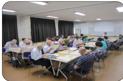
もみじ台老人クラブもみじ台みなみ会