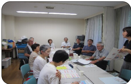
上野幌中央第1町内会

ご高齢のある参加者の方からは、「まもなく自分の方が見守られる側になる。見守られる方も考えていかないと。」との声が聞かれました。